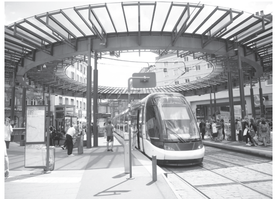
写真1 ストラスブールのトラム

ミュンが連携して形成された広域行政組織の中に設けられた交通施策の業務を担う機関(Autorités Organisatrices de la Mobilité, 略称 AOM)により管理されている。